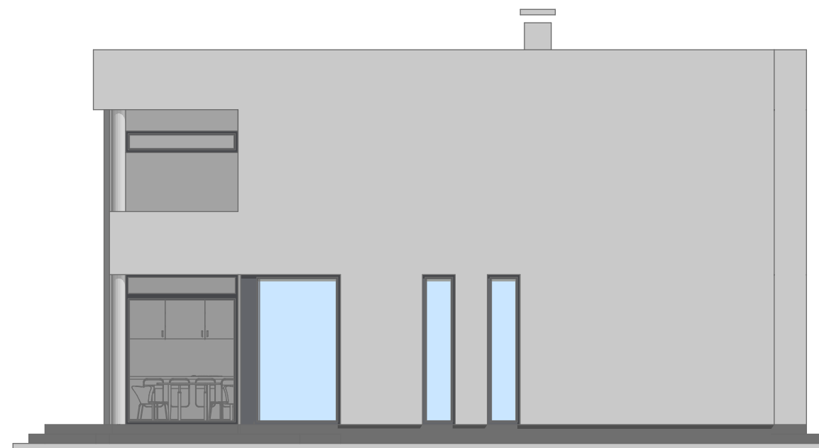
JUGO - ISTOK