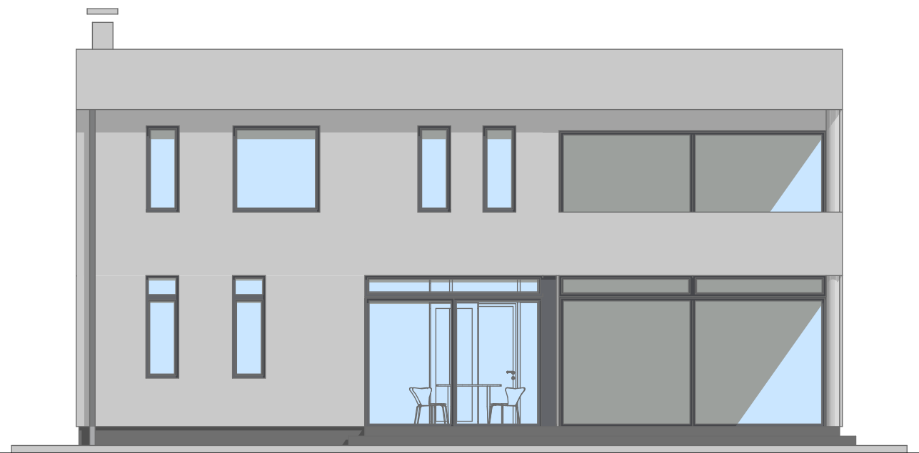
JUGO - ZAPAD