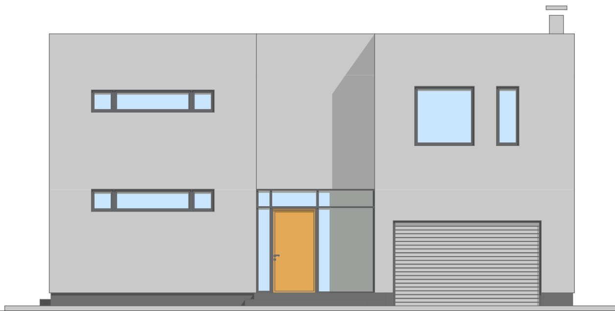
SEVERO - ISTOK